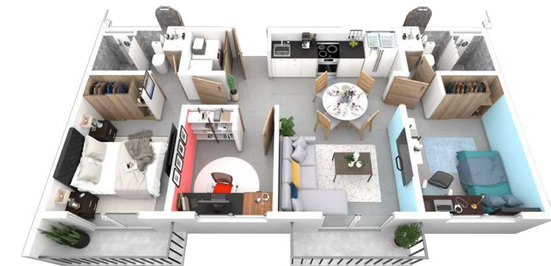
2 habitaciones con estudio